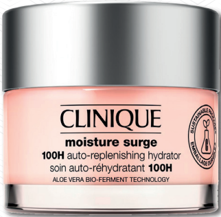
CLINIQUE Moisture Surge 100H Gel Cream 125 ml