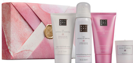
RITUALS The Rituals of Sakura Foaming Shower Gel 50 ml Bodyscrub 70 ml Bodycrème 70 ml Mini Geurkaars