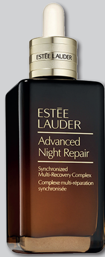
ESTÉE LAUDER Advanced Night Repair Serum 115 ml