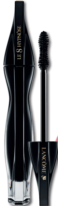
LANCÔME Hypnôse Le 8 mascara zwart