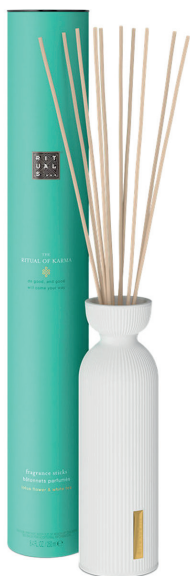
RITUALS The Ritual of Karma Fragrance Sticks 250 ml