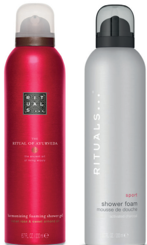
RITUALS The Ritual of Ayurveda Foaming Showergel 200 ml Rituals Sport Foaming Showergel 200 ml