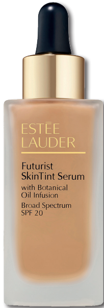
ESTÉE LAUDER Futurist Skin Tint Dawn 30 ml