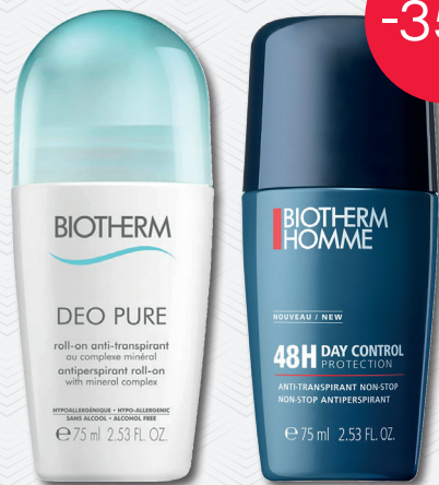
BIOThERM Pure of Homme Deodorant Roll-On 75 ml