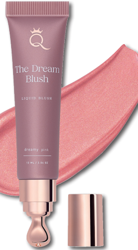
QUEEN TARZI* Dream Blush Dreamy Pink 12 ml