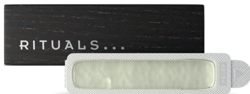
RITUALS The Ritual of Sakura Car Perfume