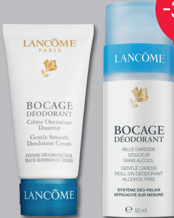
LANCÔME Bocage Déodorant Cream of Roll-On 50 ml